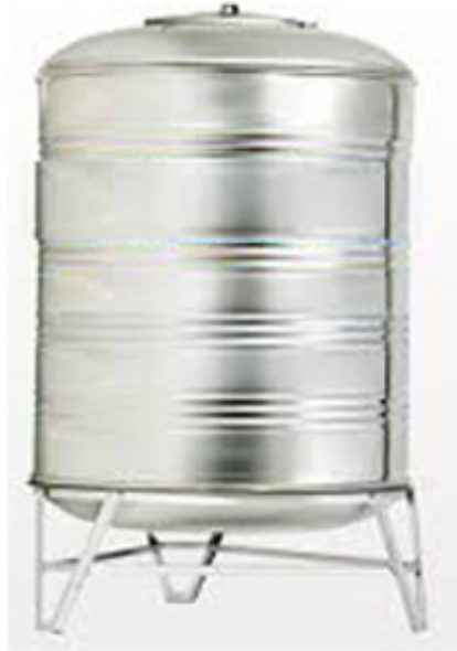
Bồn inox đứng