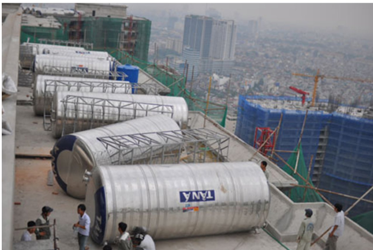
gia inox - dung tích bồn chứa nước