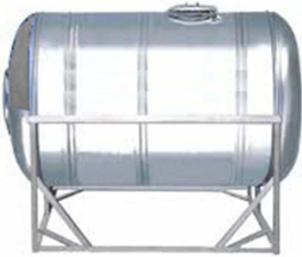
Bồn inox nằm